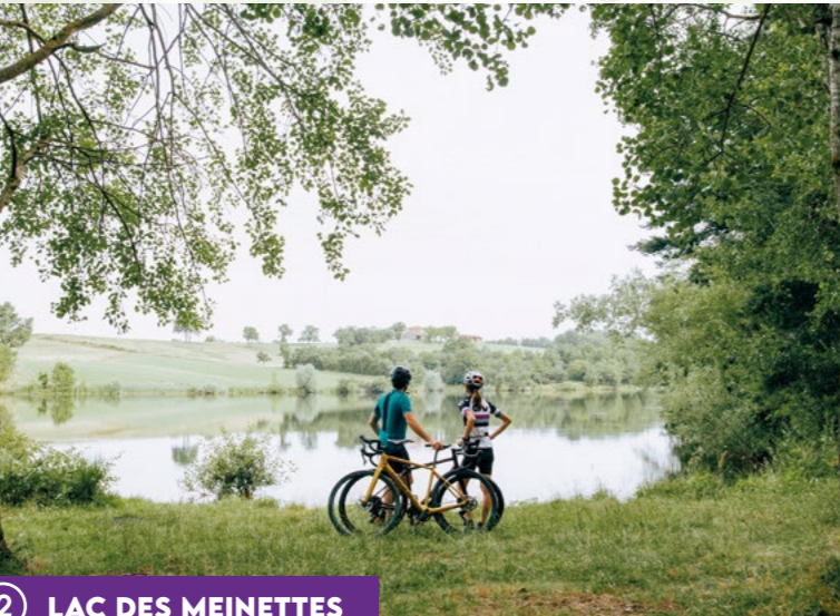
2 LAC DES MEINETTES