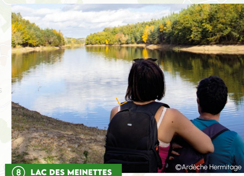
8 LAC DES MEINETTES