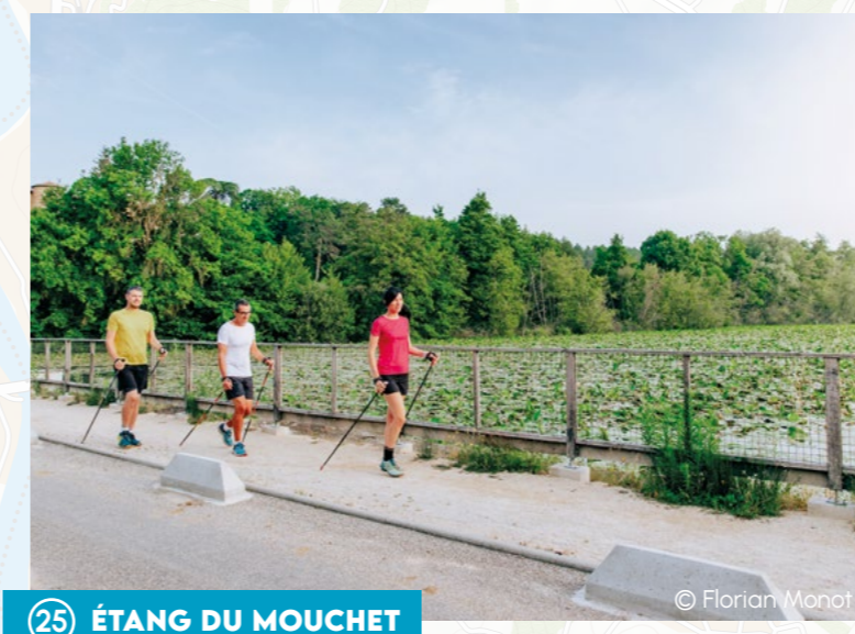
25 ÉTANG DU MOUCHET