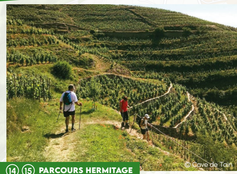
14 15 PARCOURS HERMITAGE