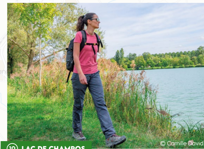
19 LAC DE CHAMPOS