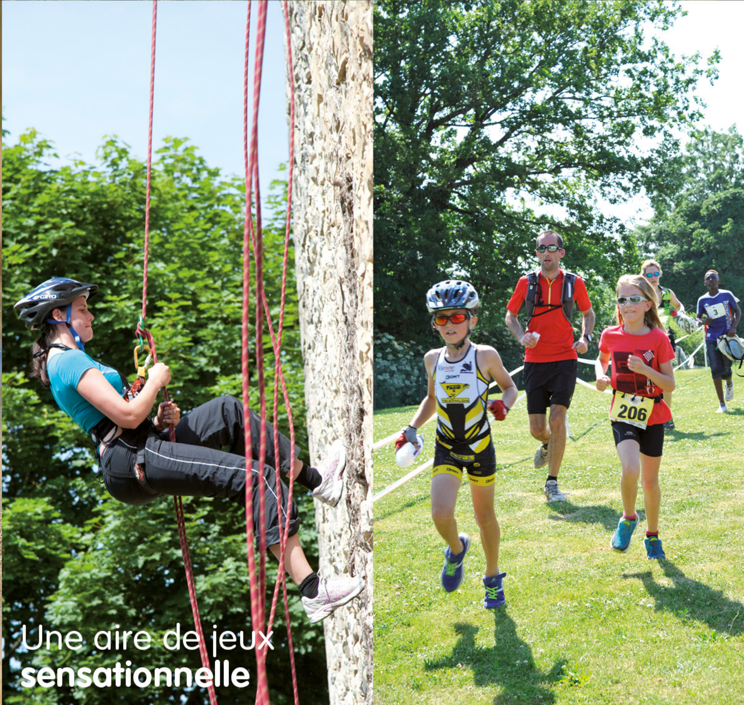
Une aire de jeux sensationnelle