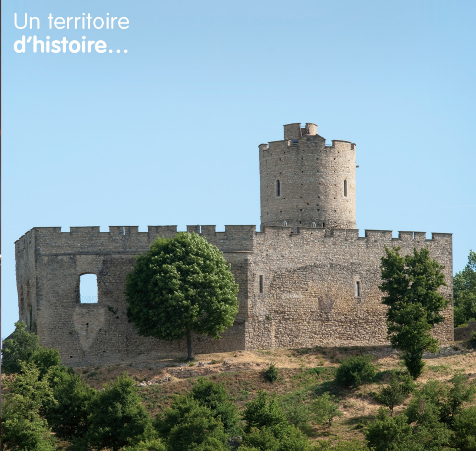
Un territoire d'histoire...