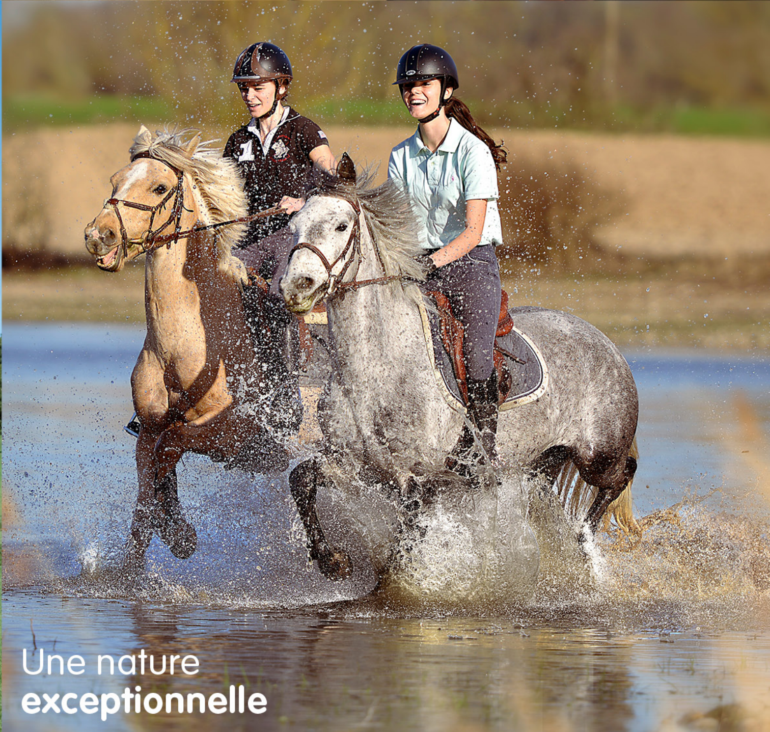
Une nature exceptionnelle