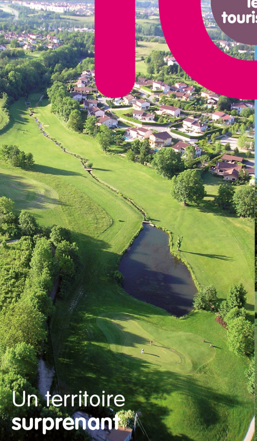
Un territoire surprenant