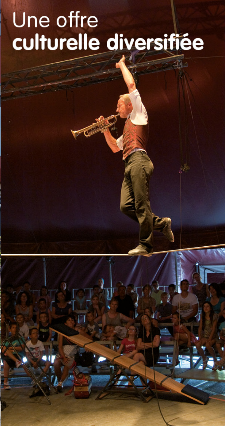
Une offre culturelle diversifiée