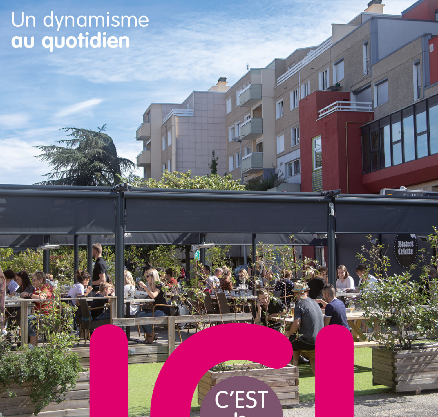
Un dynamisme au quotidien